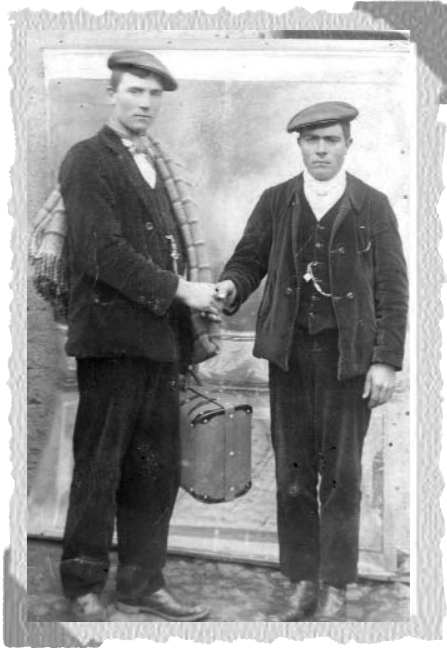
Despedida de un emigrante.