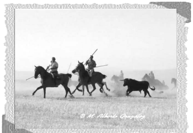
Encierro a caballo.